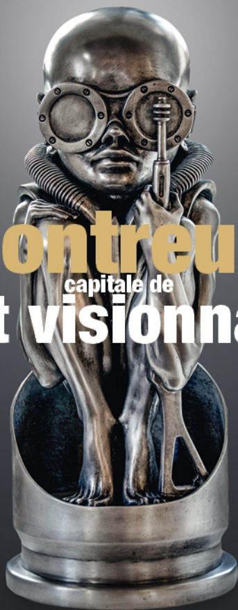
HR Giger, "Birth Machine Baby", bronze, 53 x 22 x 22 cm, Musée HR Giger, Suisse